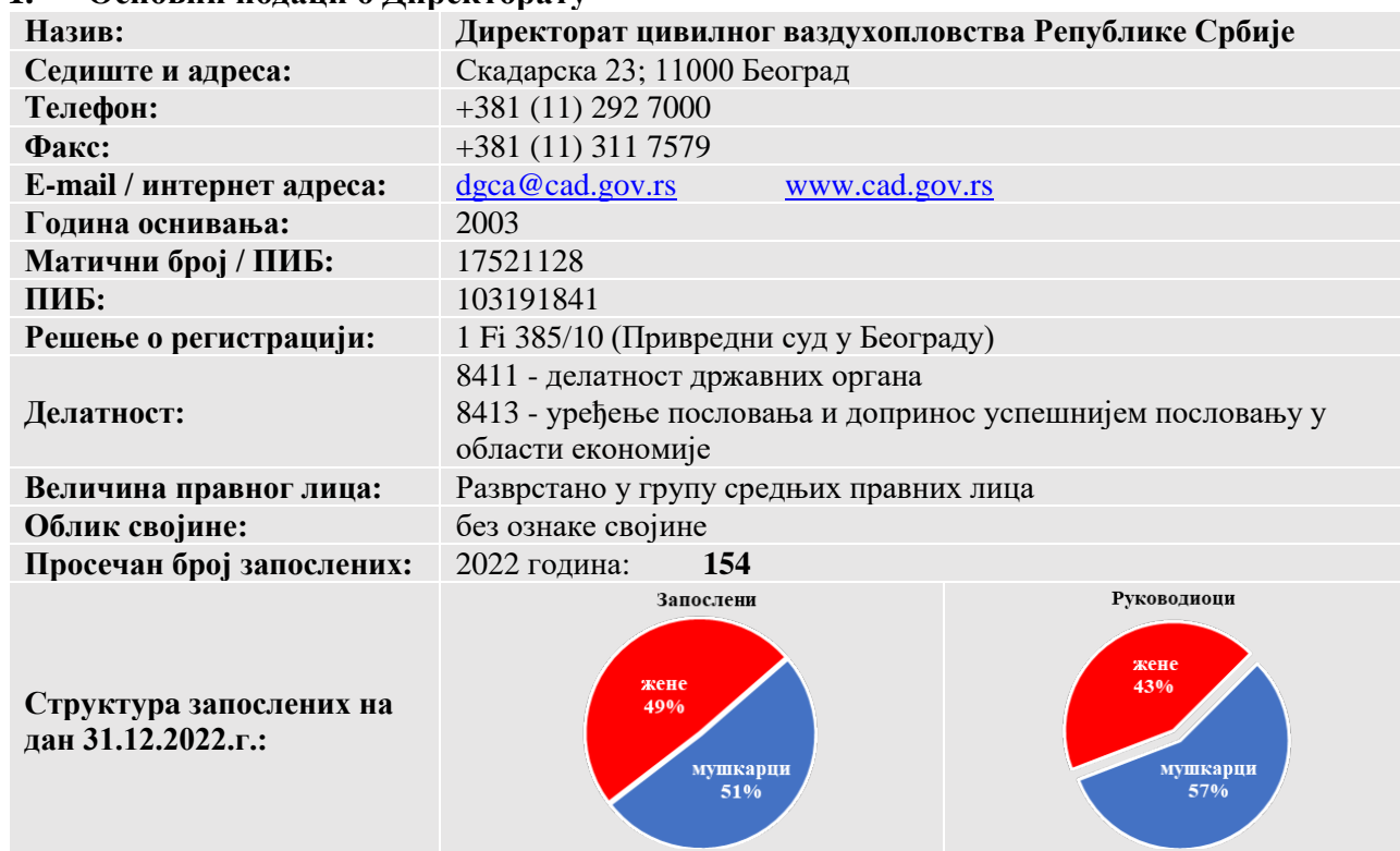
Табела 1: Основни подаци о Директорату